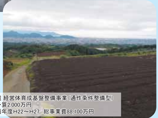
⑥箱根西麓 経営体育成基盤整備事業(通作条件整備型) 24年度予算2,000万円 事業計画年度H22～H27 総事業費88,100万円