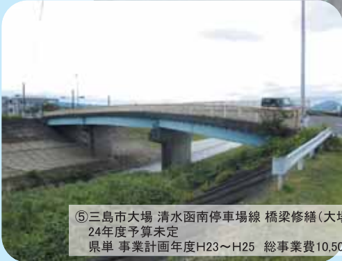
⑤三島市大場 清水函南停車場線 橋梁修繕(大場橋) 24年度予算未定 県単 事業計画年度H23～H25 総事業費10,500万円(未定)