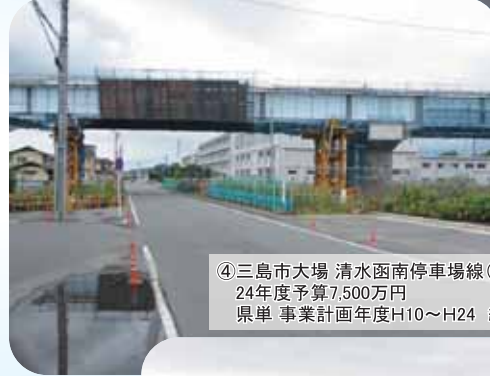
④三島市大場 清水函南停車場線(高規格関連) 24年度予算7,500万円 県単 事業計画年度H10～H24 総事業費37,100万円