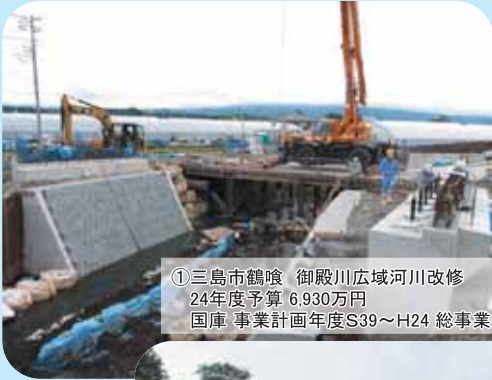
①三島市鶴喰 御殿川広域河川改修 24年度予算 6,930万円 国庫 事業計画年度S39～H24 総事業費304,400万円