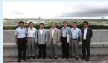
防衛局から嘉手納基地