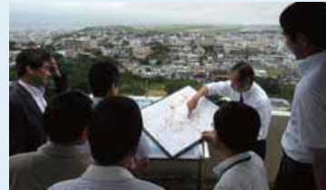
普天間基地の現況説明