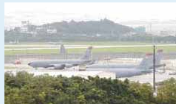
米軍の嘉手納基地は極東最大の空軍基地