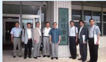
真部沖縄防衛局長と