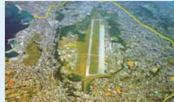
普天間基地 航空写真