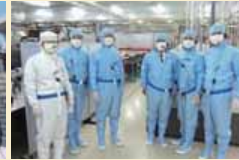
実験研究室を視察

研究所で原子炉と核融合炉の構造の違い、核融合の安全性・実用化可能性など説明を伺い、実験研究室では直接核融合炉と成果について現場を視察した。