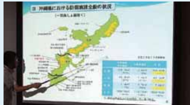
沖縄県の防衛施設状況