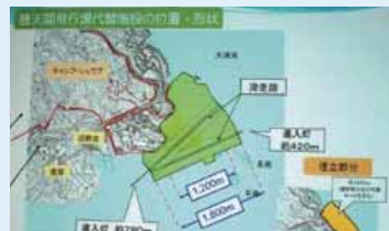
辺野古崎地区の移転計画