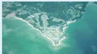
辺野古崎の航空写真