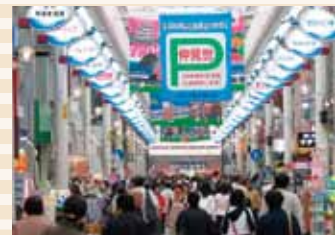
▲沼津仲見世商店街