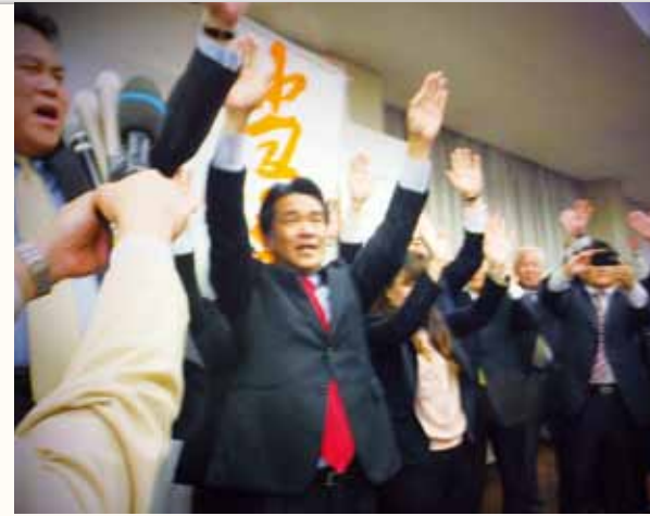
▲当選確実の報に事務所内は歓喜に包まれました。